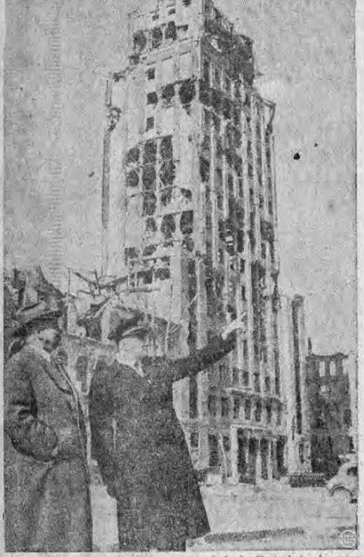
El Ten. William Tonesk, asistente naval de la Embajada Americana en Polonia, indica al ex presidente Hoover quien viaja por Europa llevando la representación del Presidente Truman para resolver el problema de los alimentos que amenaza de muerte a millones de personas, los lugares más devastados por la guerra en Polonia. Esta república fue una de las que mayores daños sufrieron durante la última guerra y el hambre amenaza a miles de niños que de no ser alimentados morirán irremisiblemente.